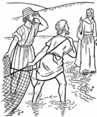
By the Sea of Galilee, Jesus saw two brothers, Simon and Andrew, fishing. He told them to follow Him and become fishers of men.

Coloring & Activity Pages by: Bible-Printables.com